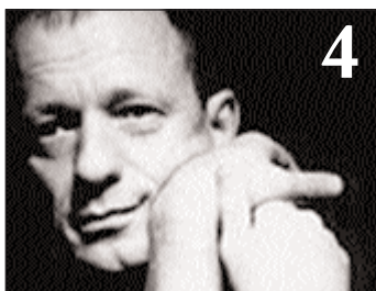
Rád zvedám hozenou rukavici