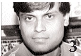
„Bengálec“ chystá nový projekt