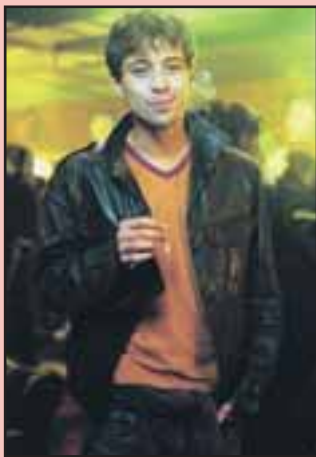
Mstitel Jakub v drogovém opojení

Největším přínosem Perníkové věže je autentické zachycení prostředí barů, diskoték a „brlohů“, ve kterém se