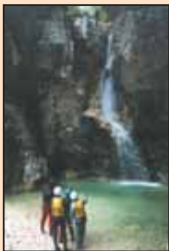
Katedrála - kaňon Fratarica

Dole je krásná a hluboká modrá tůň. Skočíte! Chvilí letíte, ruce zkřížené na prsou. Dopad do vody, a pak už vás vesta vynese nad hladinu, kde se můžete nadechnout. Nebo musíte slanit. Spustíte lano, provléknete ho slaňovací osmou a se srdcem až v krku se poprvé vyvěsíte nad tu hloubku. Voda padá kolem vás a buší do přilby. Předkloníte hlavu, aby jste mohli volněji dýchat a vychutnávat adrenalin hrnoucí se vám do krve. Dole se kolem vás všechno vaří. Chcete plavat, jde to jen těžko, protože jste stále na laně. Proud vás ale