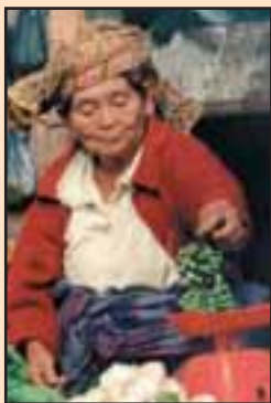
Batacká žena na trhu

vinutou kulturou a písmem, byl tehdejší „civilizovaný“ svět šokován. Batakové se stali podnětem k rozsáhlému vědeckému bádání. Bylo zjištěno, že jsou potomci neolitických horských kmenů, které vyhnali Mongolové z jejich původního území v oblasti dnešního severního Thajska a Barmy. Když dorazili na Sumatru, nesetrvávali dlouho na mořském pobřeží, ale vydali se dále do vnitrozemí. Po několikátým denním putování objevili jezero Toba, kde se usídlili a žili zde v naprosté izolaci od okolí dlouhá staletí.