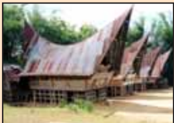
Vesnice obehnaná bambusovým plotem

ostrov, až jednoho dne se nejvyšší představitelé dohodli, že je potřeba tuto situaci už jednou provždy vyřešit.