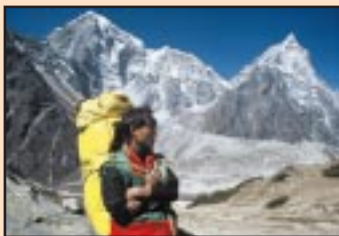
Nepálský nosič pod Thamsenku

Nejrozšířenější a nevyhledávanější turistickou aktivitou v Nepálu je trekking. Děletrvající pěší výlet do Himálaje po více či méně zřetelných horských pěšinách nabízí seznámení s místní kulturou, sportovní výkon i trekařský cíl. Ze začátku svaly bolí, nohy otekají a batoh tíží. Koncem prvního týdne si ale tělo zvykne a trekař je překvapen svojí silou, energií a pružnými svaly. Jak se postupně zlepšuje fyzická kondice, jak ubíhá den za dnem, tak se mysl oprostuje od všeho nepodstatného a příroda a domorodci jsou bližší. Ve shonu civilizovaného světa je jen zřídka těšime z čistých okamžiků, ale zde tyto