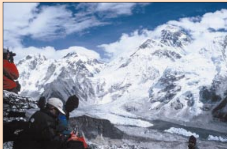
Zmrzlá kolejnice v okolí bc Everest

půvabně rozloženo na širokých terasách ve svahu půlkruhového přírodního amfiteátru s kulisou štítů Kongde Ri a Thamserku. Administrativní centrum národa Šerpů vlastní policejní osádku, telefonní a faxovou stanici, zubní ordinaci, směnárnu, pekárny a spoustu lodží, sídlí tu i ředitelství národního parku. Namche Bazar bylo v minulosti střediskem obchodu, kdy se tu potkávaly tibetské karavany s indickými obchodníky. Turisté se zde rádi jeden den zdrží, protože okolí nabízí návštěvy odlehlejších vesnic Khunde a Khumjung nebo hezkou procház-