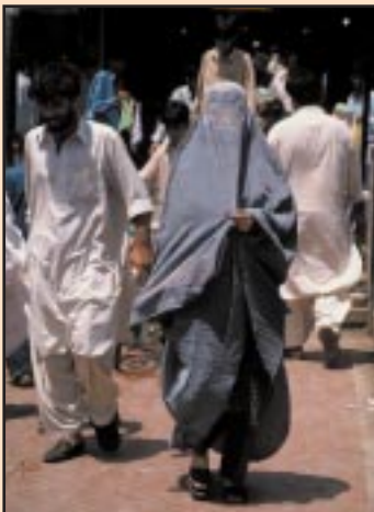
Tradiční oděv paštúnských žen

Ačkoliv je v této svaté knize napsáno, že muž i žena jsou si před Bohem rovni, v realitě jsou si muži v lecčems daleko rovnější. Pro valnou většinu tradičně smýšlejících muslimských žen je zcela nemožné, aby se jakkoliv podílely na veřejném životě. Ženy vládnou světu za uzavřenými dveřmi svých domů a bytů, kde se starají o rodinu a domácnost. Zejména v severozápadních teritoriích pokud žena vyjde do ulic, musí mít s sebou jako doprovod svého manžela nebo bratra a je zahalena v tzv. burkách (speciální oděv zahalující celou po-