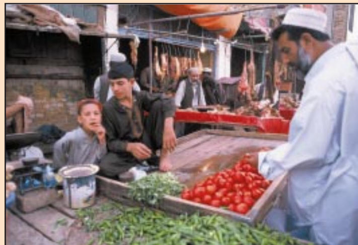
Na místním „Zelňáku“